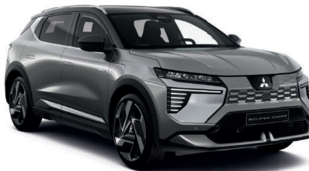
Volcanic Grey (metallic) - € 800