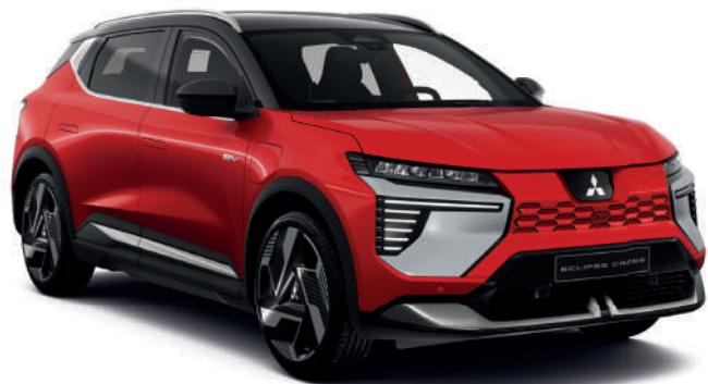
Sunrise Red (metallic) - € 0