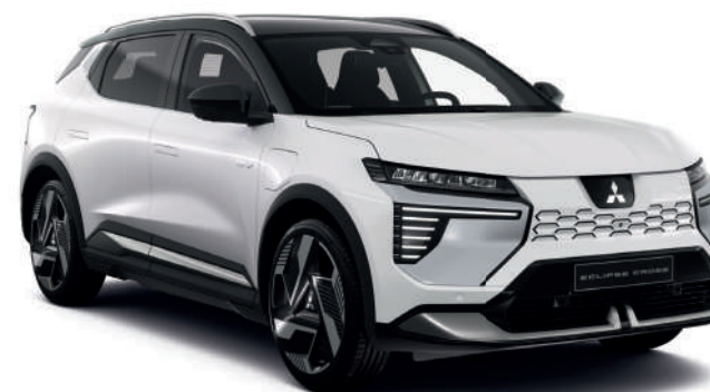
Crystal White (metallic) - € 1.000