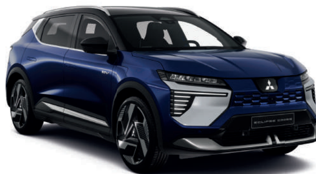
Sapphire Blue (metallic) - € 1.000