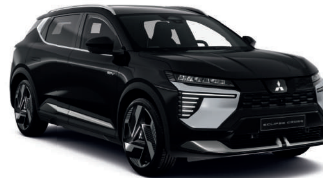
Onyx Black (metallic) - € 800