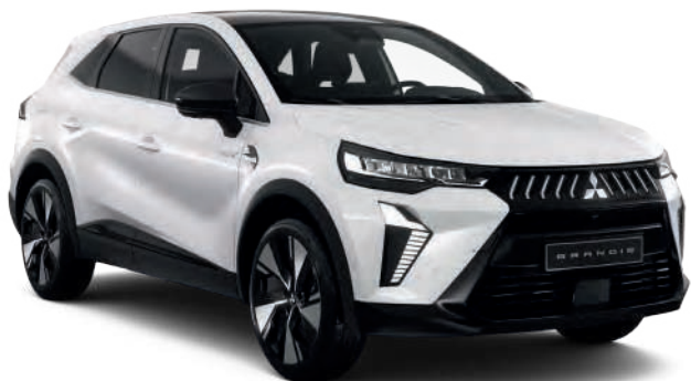
Crystal White (peinture métallisée) - 900 €