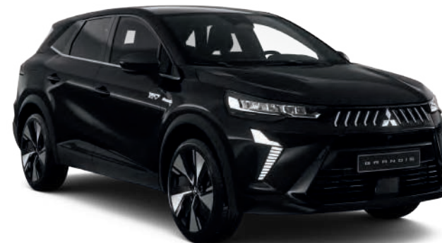
Onyx Black (peinture métallisée) - 800 €