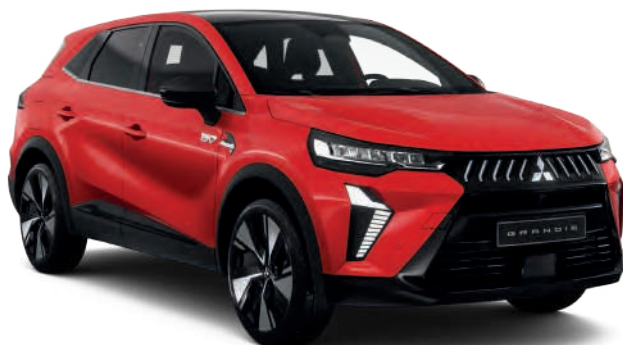
Sunrise Red (peinture métallisée) - 900 €