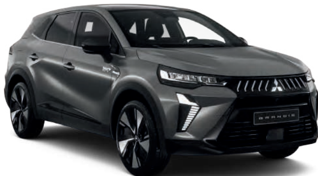
Steel Grey (peinture métallisée) - 800 €