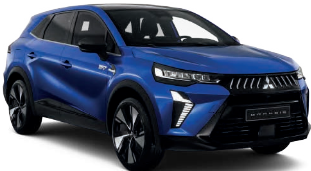
Royal Blue (peinture métallisée) - 0 €